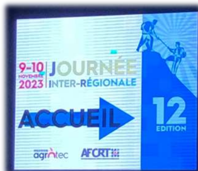
Le panneau lumineux d'accueil 3X3 m situé au rond-point de l'AGROPOLE